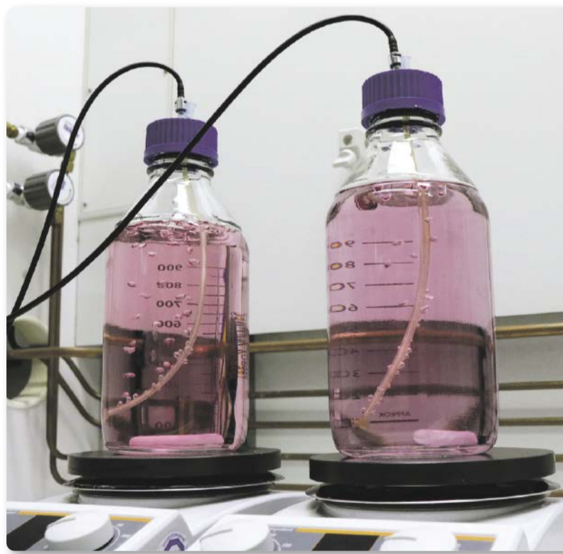
Die Herstellung sauerstofffreier Medien ist aufwendig und erfordert eine besondere Expertise.