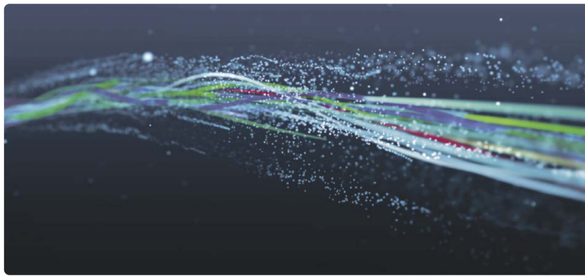
Ethernet, der allgegenwärtige Äther, hat uns im privaten Alltag und im Büro schon lange erreicht oder sogar vereinnahmt. Dringt Ethernet jetzt auch in die Feldebene der Prozessproduktion vor?

Was in den Fabriken der Automobilindustrie seit vielen Jahren Standard ist, hat sich in der Prozessfertigung noch nicht richtig durchgesetzt: Die digitale Kommunikation bis in die Feldebene, also in die Welt der Sensoren und Aktoren. Dabei wird eine flexible Produktion ohne intelligente Vernetzungen bis ins Feld nur schwer möglich sein. Mit Ethernet APL (Advanced Physical Layer) steht jetzt eine Technologie bereit, die das Potenzial für einen Game Changer hat.