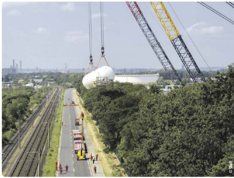
Sichtbares Symbol der Energiewende: Shell hebt drei Bio-LNG-Tanks in den Energy and Chemicals Park Rheinland

Mit der Transformation zu einem nachhaltigen Chemiepark bewegt Shell im Rheinland derzeit Großes. Sichtbares Symbol für die ambitionierte Wende hin zu einem Netto-Null-Emissionen-Unternehmen ist Ende Juli die Anlieferung von drei 50 m langen und 6 m hohen Tanks für eine neue Bio-LNG-Anlage gewesen (Liquefied Natural Gas). Um für den Transport in den Park keine Bäume fällen zu müssen, sind die 246 t schweren Kolosse über die Bäume gehievt worden. Ein spektakuläres Event sowie eine logistische Herausforderung.