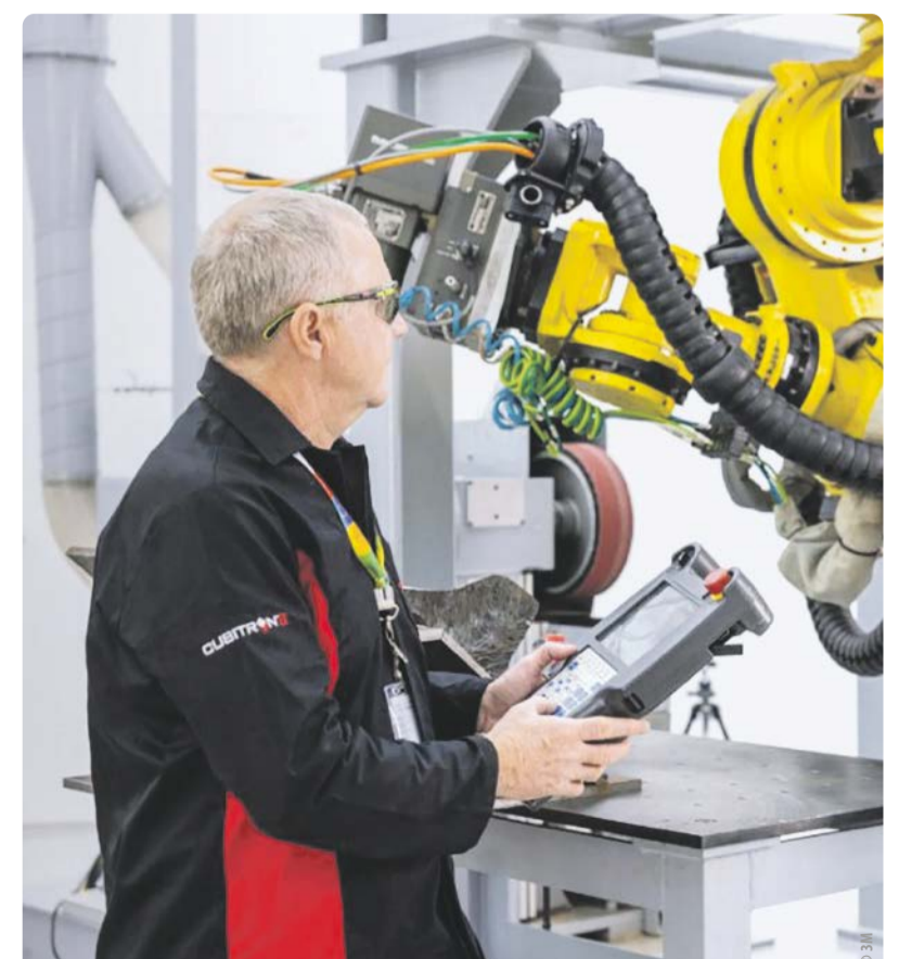
Künstliche Intelligenz und Robotics sind für 3M wichtige Innovationstreiber.