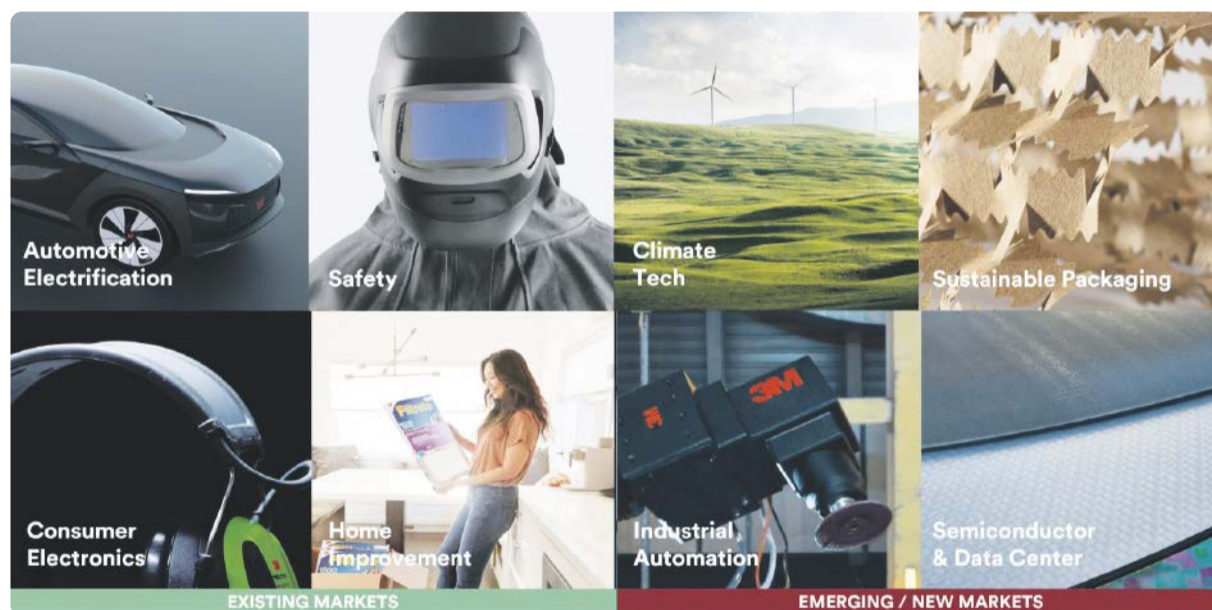
3M bietet ein breites Portfolio an Lösungen für bestehende und neue Märkte.

Wir werden KI nutzen, um Innovationen voranzutreiben und die Produktivität zu steigern.